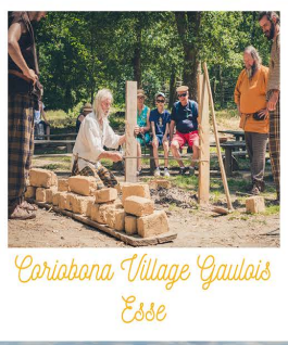
Coriabona Village Gaulois Esse