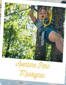
Aventure Parc Massignac